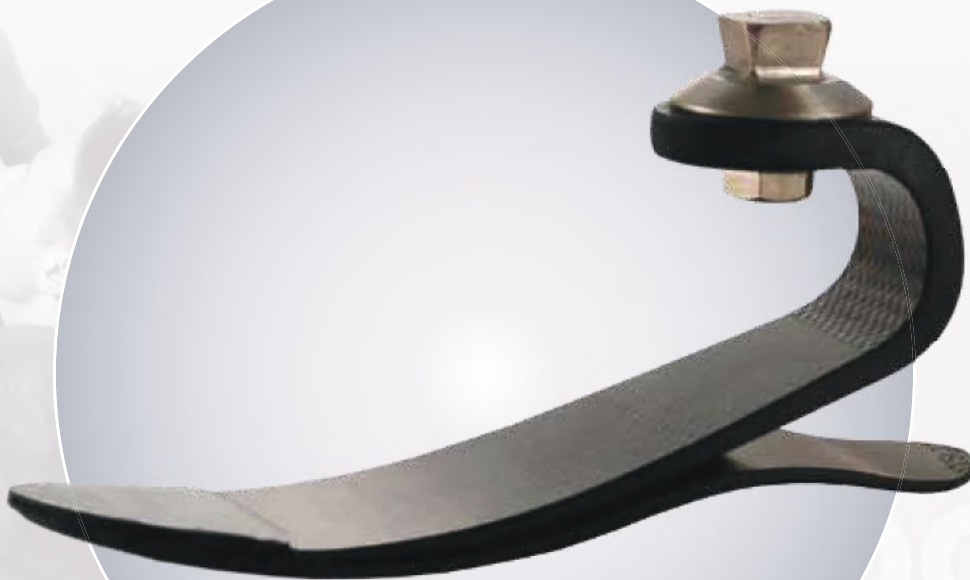
Defender Pediatric (FS3)