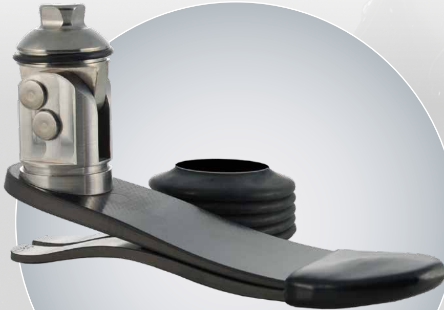
Freestyle Swim (LP2-W2)