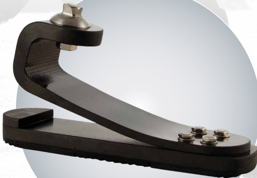
Slalom Ski (SKI)