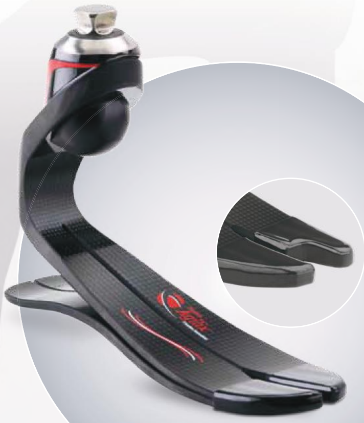
Freedom Agilix (F15)