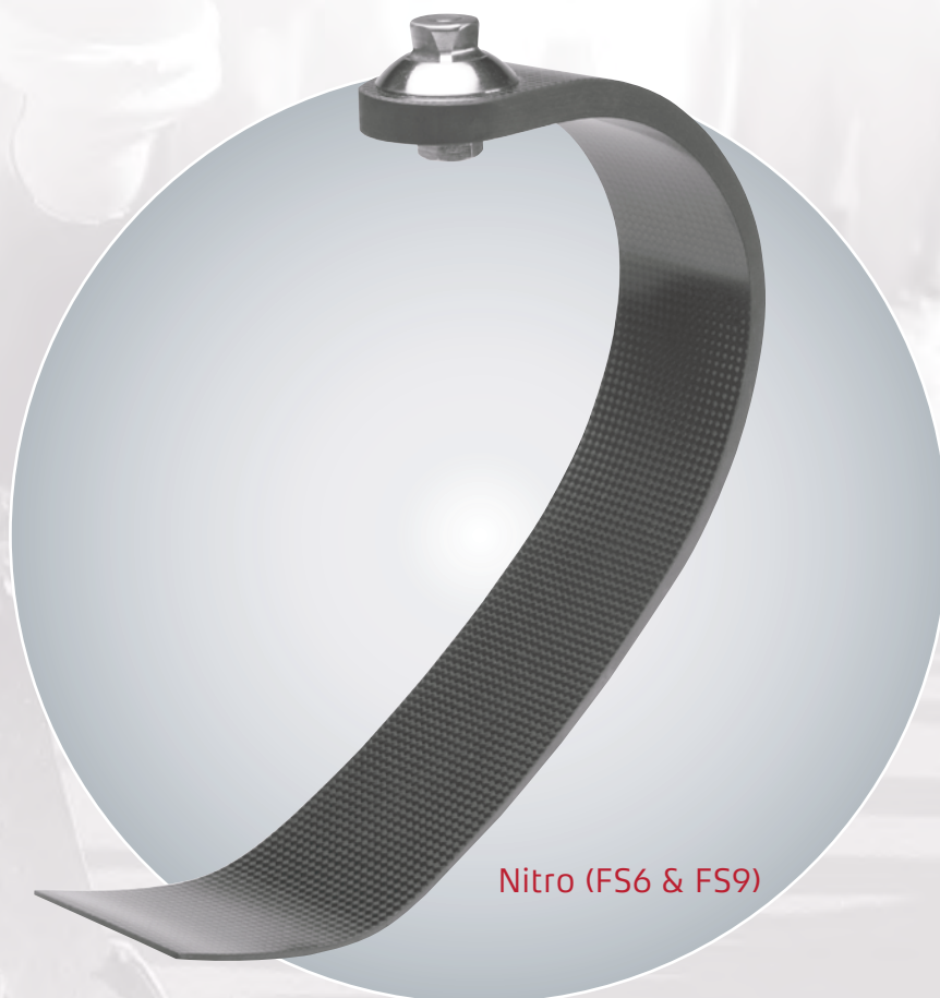
Nitro (FS6 & FS9)