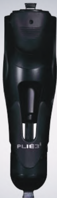
Genou Plié 3 MPC

Notre technologie à réponse rapide offre une transition plus naturelle entre la phase d'appui et la phase pendulaire. La résistance est basée sur la flexion en phase pendulaire et non sur la vitesse. Le résultat, est un fonctionnement instinctif se rapprochant d'un vrai genou, réduisant l'effort et éliminant la sensation de « marcher dans la boue » caractéristique d'autres genoux hydrauliques.