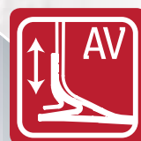
Renegade LP-A·T (R16)