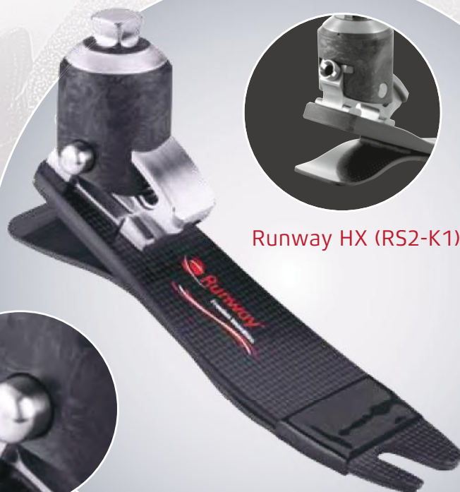
Runway HX (RS2-K1)