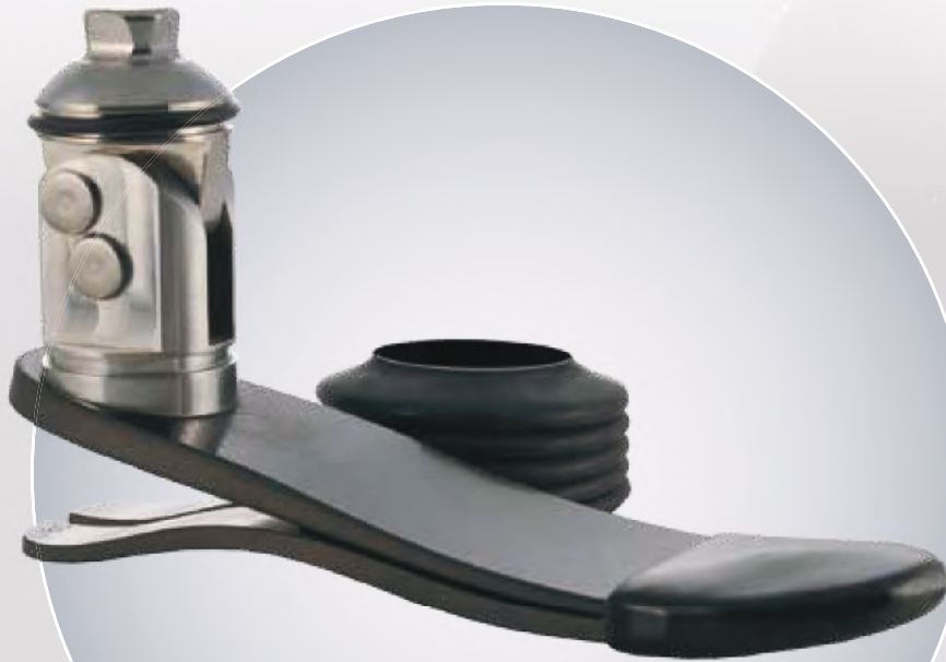
Freestyle Swim (LP2-W2)