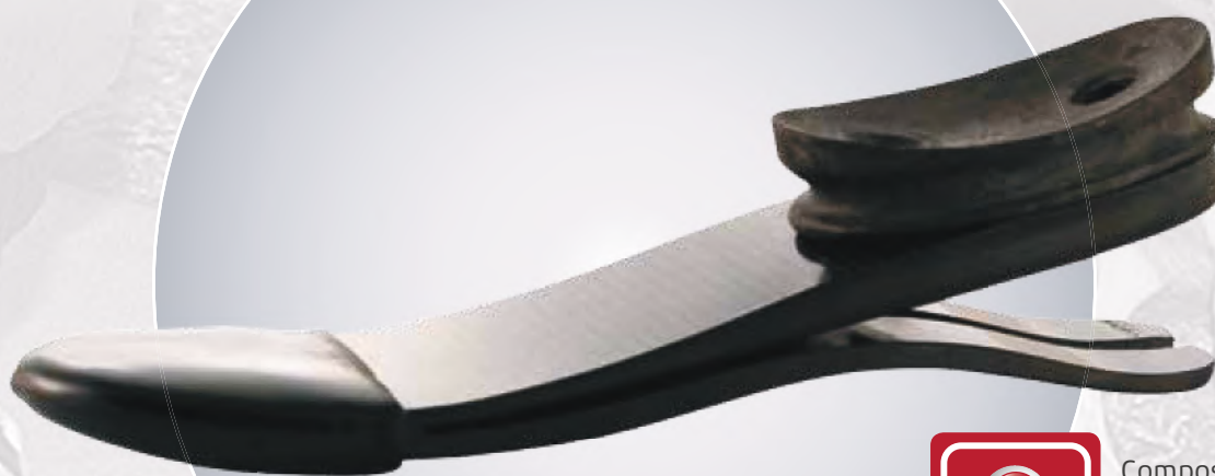
LP Symes (LP2)